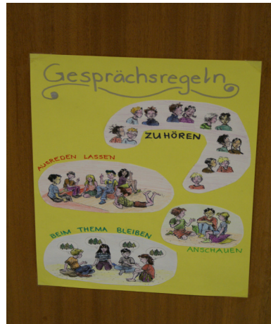
Gesprächsregeln als Hilfsmittel für eine gute Kommunikationskultur

Die befragten Schülerinnen und Schüler bringen klar zum Ausdruck, dass sie sich an ihrer Schule weniger Streit und weniger Lärm wünschen.