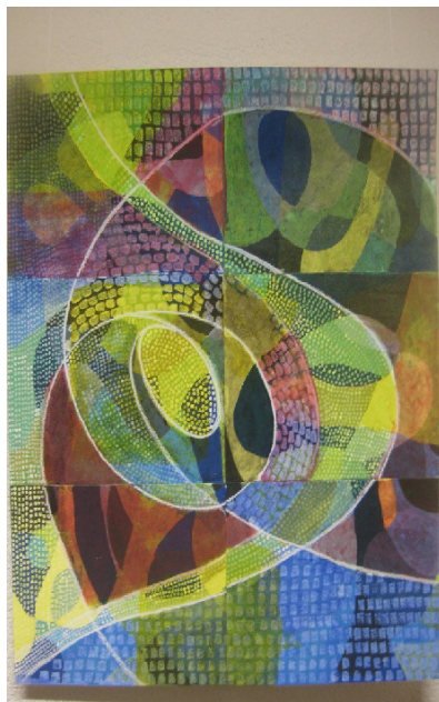
Gemeinschaftsbild gestaltet vom Kollegium

Die Homepage der Schule Frenkendorf ist benützerfreundlich und grafisch schön gestaltet. Sie bietet interessierten Personen eine umfassende und vielseitige Übersicht über die Schule. Die Informationen sind auf dem aktuellen Stand. Das Evaluationsteam ist beeindruckt von der guten Qualität der Homepage.