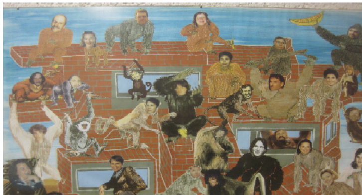
Humor und Lachen gehört zum Schulalltag